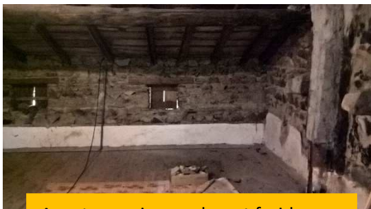
Avant : grenier sombre et froid